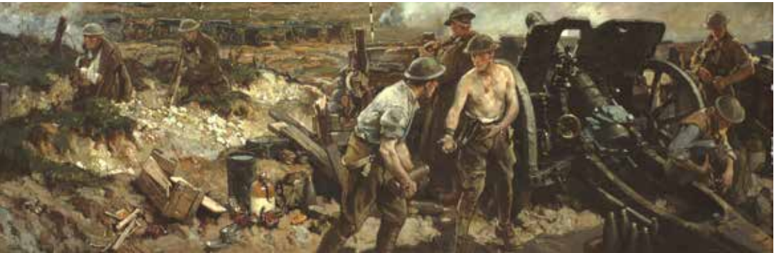
Tableau de la bataille de la crête de Vimy par Richard JACK (1866-1952)